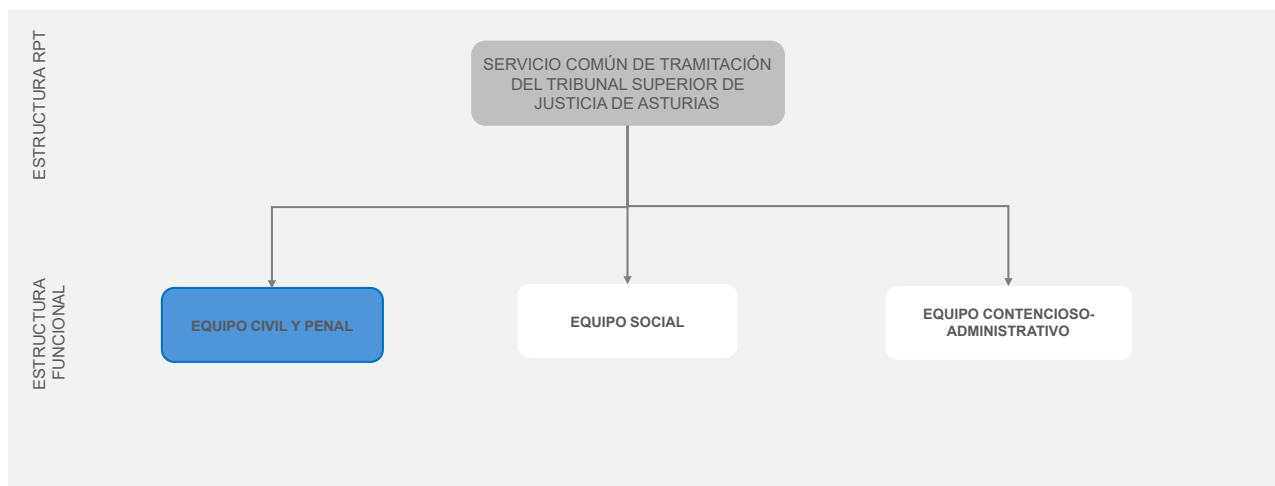
Ilustración 3. Estructura del Servicio Común de Tramitación de la Tribunal Superior de Justicia de Oviedo – Equipo Civil y Penal