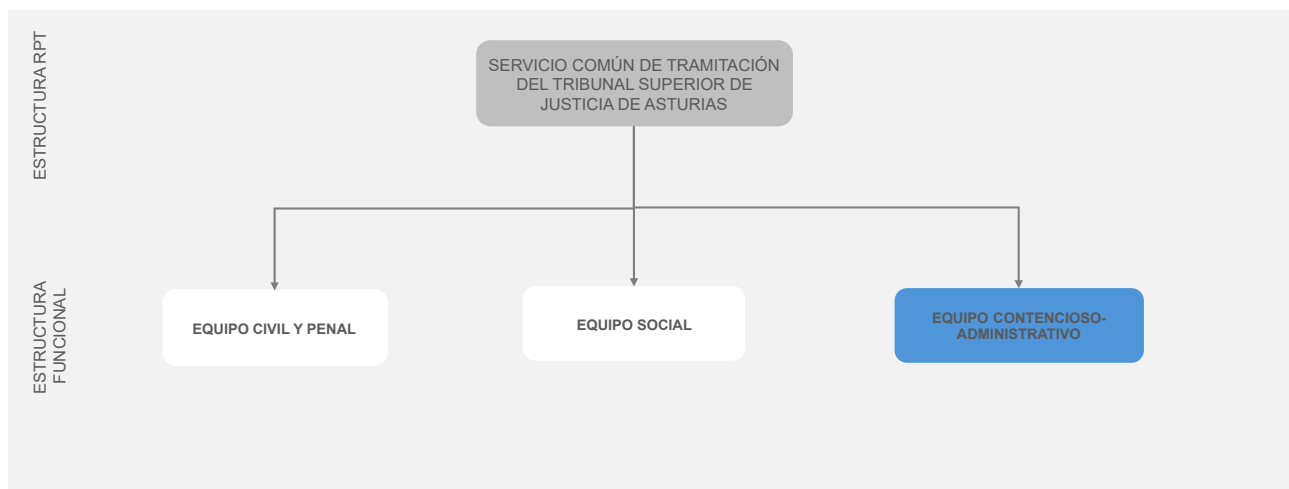
Ilustración 5. Estructura del Servicio Común de Tramitación de la Tribunal Superior de Justicia de Oviedo – Equipo Contencioso-Adm