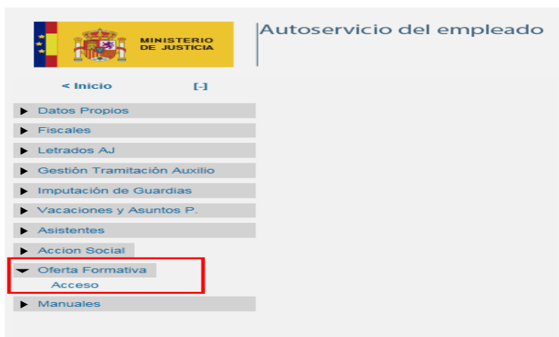
Figura 1 – Autoservicio del empleado

Para acceder a la participación en las acciones formativas, deberán remitir la correspondiente solicitud electrónica implantada en el apartado Oferta Formativa a través del Autoservicio del empleado de AINOA.