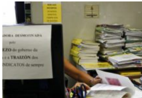
NOTICIA EXTRAÍDA DEL DIARIO DIGITAL "LA VOZ DE GALICIA":

https://www.lavozdeg Galicia.es/noticia/vigo/vigo/2018/09/21/250-funcionarios-haran-5000-horas-extras-mes-desatascar-juzgados/0003_201809V21C2994.htm